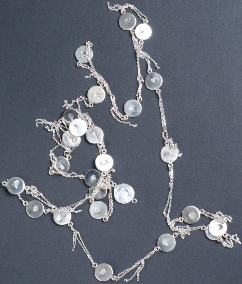
„3/1000 Talent“ 2011, Kette; Silber / necklace; silver